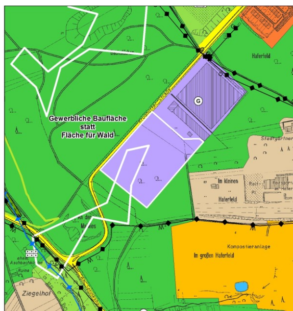
Kartenausschnitt mit Genehmigung des LKVK(LB/024/86)