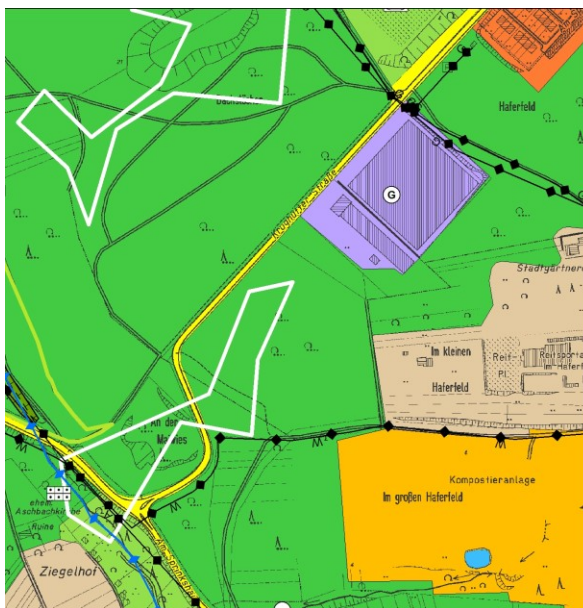
Kartenausschnitt mit Genehmigung des LKVK (LB/024/86)